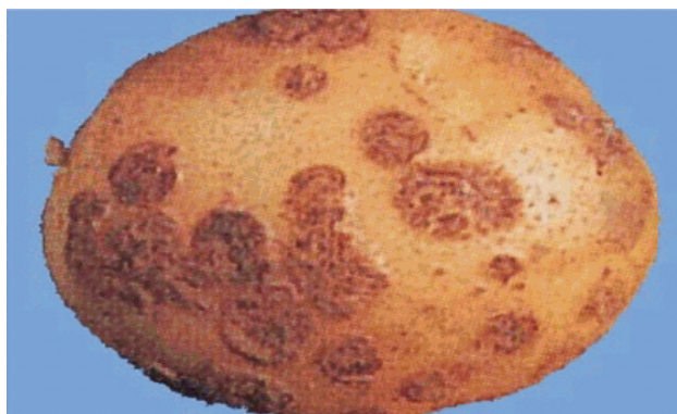
Рисунок 1. Парша обыкновенная [3] (поражено 33,3% поверхности клубня)

6.5.2. Определение площади пораженной поверхности клубня паршой (обыкновенная, сетчатая, порошистая) и ризоктонией - по [3] . Клубень считается пораженным болезнью, если площадь пораженной поверхности паршой обыкновенной превышает 33,3% или более 1/3 поверхности (см. рисунок 1), паршой сетчатой - 33,3% (см. рисунок 2 ), паршой порошистой - 10% (см. рисунок 3 ), ризоктонией - 10% (см. рисунок 4 ).