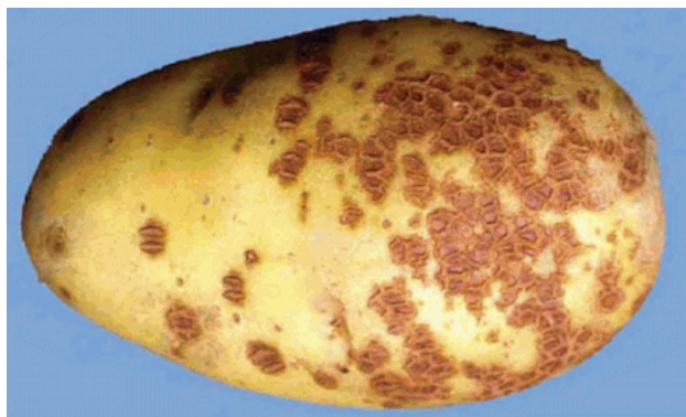
Рисунок 2. Парша сетчатая [3] (поражено 33,3% поверхности клубня)