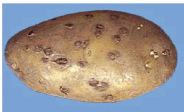
Рисунок 3. Парша порошистая [3] (поражено 10% поверхности клубня)